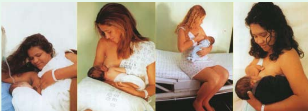
Posição de Jogador de Futebol Americano