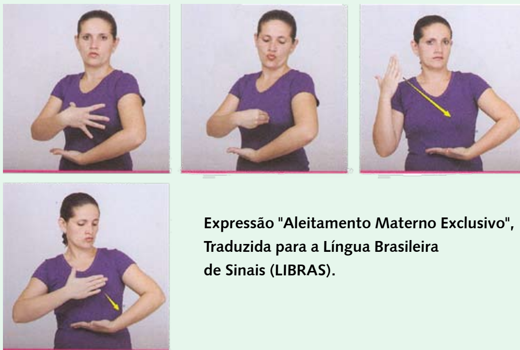
Expressão "Aleitamento Materno Exclusivo", Traduzida para a Língua Brasileira de Sinais (LIBRAS).

Em algumas ocasiões o profissional de saúde pode se deparar com mães com necessidades especiais como, por exemplo, limitações físicas, auditivas ou visuais que dificultem certas técnicas de amamentação. Essas situações exigem maior habilidade em relação à comunicação em saúde e maior suporte por parte da família e dos profissionais em relação às eventuais dificuldades inerentes ao manejo do aleitamento. O apoio do serviço de saúde também nessas circunstâncias concorre para o aumento do vínculo entre os profissionais e a dupla mãe-bebê e a família, bem como consolidam direitos humanos de forma inclusiva.