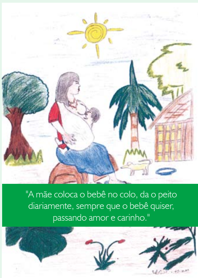
Ilustração da etnia Guarani/Kaiowá, localizada no Mato Grosso do Sul

"A mãe coloca o bebê no colo, da o peito diariamente, sempre que o bebê quiser, passando amor e carinho."